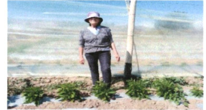
Mejoramiento a los Invernaderos