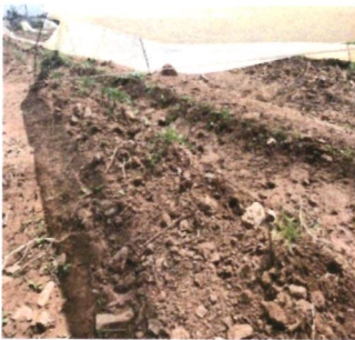
Holladura para plantación de frutales