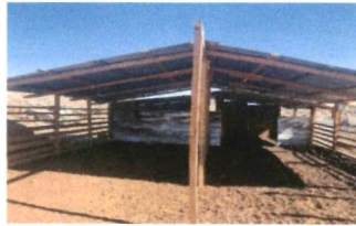
Mejoramiento a los Corral