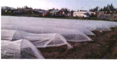
Micro Túneles Agrícolas

Eje Social: Está relacionado a mejorar la calidad de vida del usuario. Proyectos para mejorar la rentabilidad, producción en época de invierno mejorando el micro clima del cultivo.