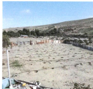
Micro Túneles Agrícolas