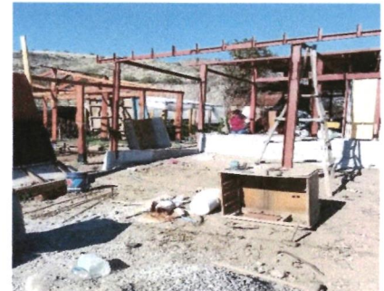
Sala de venta y almacenamiento

Eje Productivo: contribuye a mejorar la rentabilidad y producción familiar campesina: